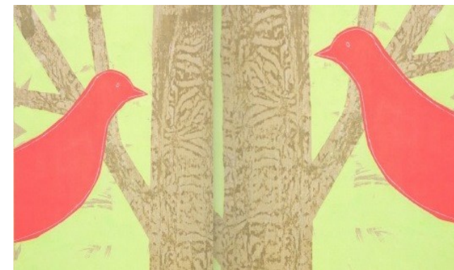
Illustrazioni da "C'era un ramo" di Giovanna Francesca Zoboli