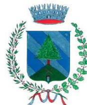
Comune di Fierozzo