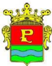
Comune di Pergine Valsugana