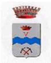
Comune di Sant'Orsola Terme